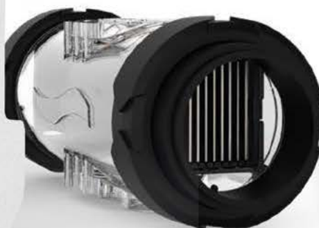
Cellule PRO M 60/90