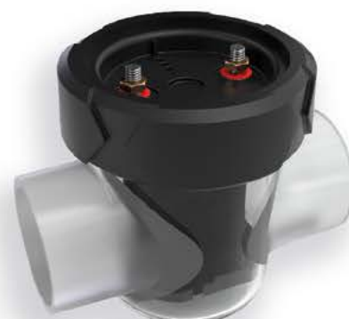
Cellule PRO M 30