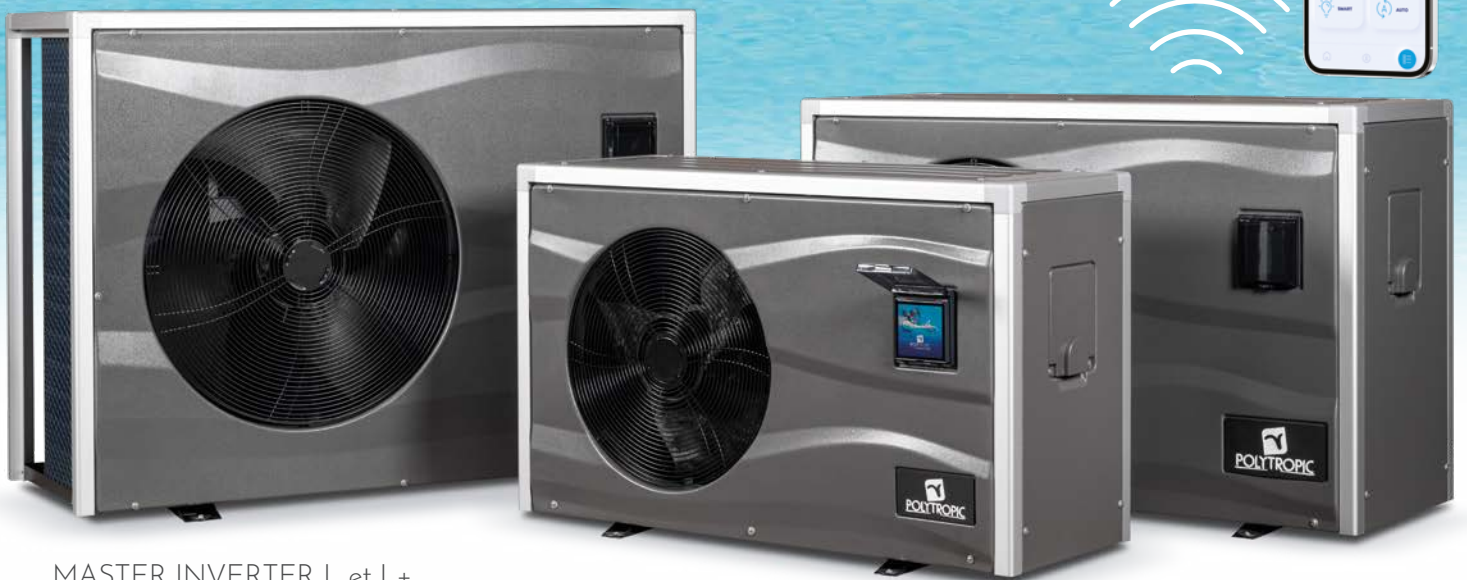
MASTER INVERTER L et L+